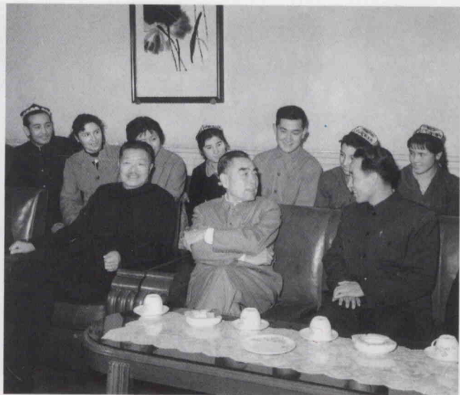
جۇڭبۇلەي زۇڭلى، مارشال خې لوڭنىڭ ئىسمائىل ئەھمەد قاتارلىق شىنجاڭ ۋەكىللىرىنى قوبۇل قىلغان ۋاقتى.