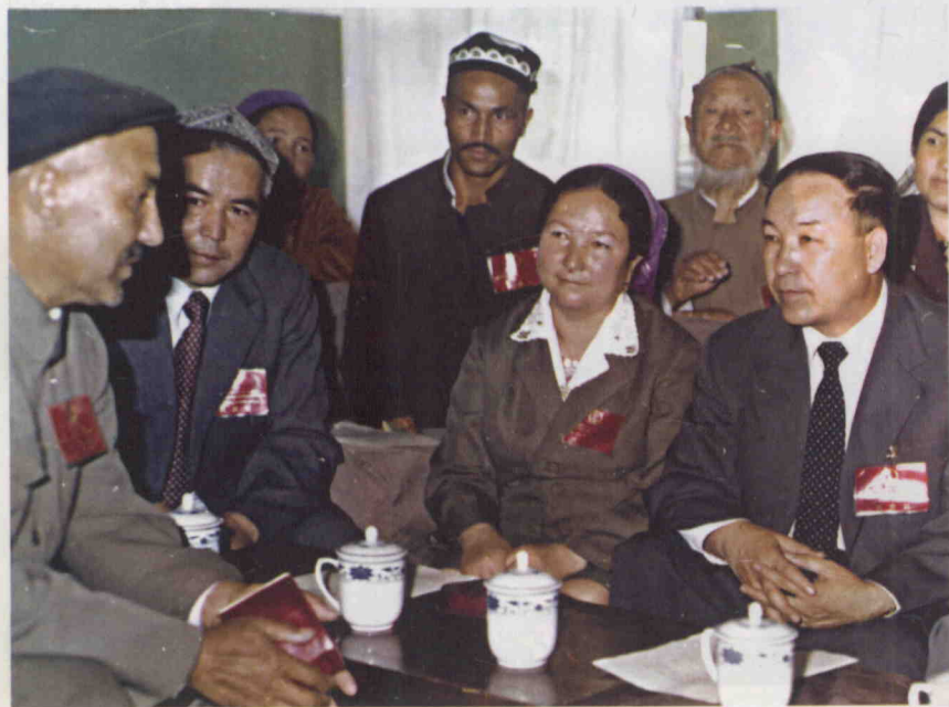
قىسمەن قۇرۇلتاي ۋەكىللىرى بىلەن سۆھبەتتە