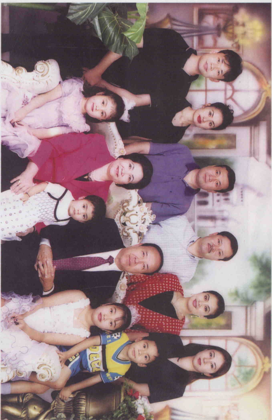
یولداش قسمایل قههده تاتلیس سنلرکله یولداش