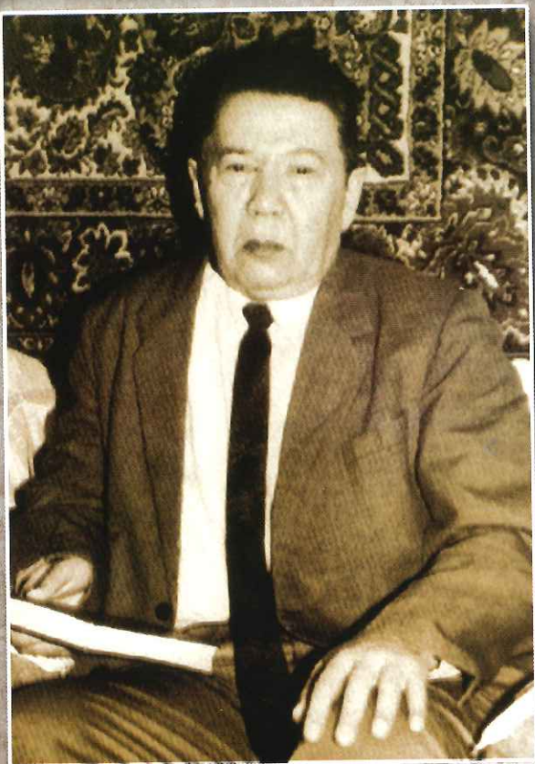
مؤلف مرتجان سادى