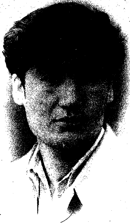
جالالدين به هرام 1962-ييل