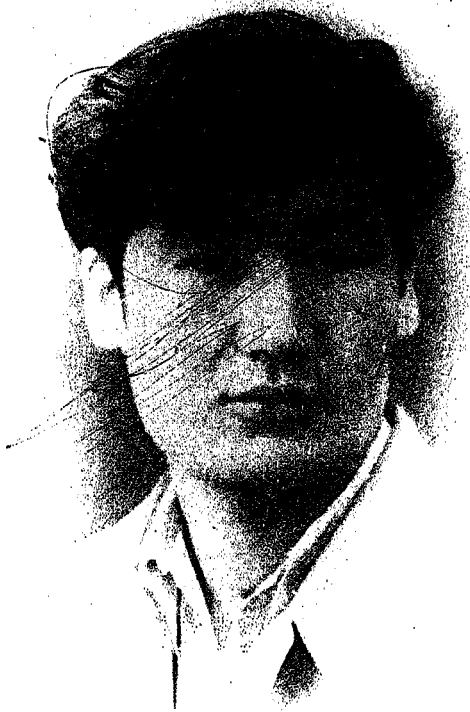
جالالدين بهرام 1962-يىل