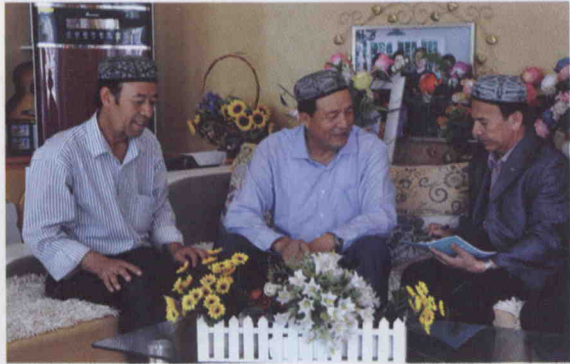
ئابدۇراخمان قۇربان ئاپتونۇرلار بىلەن بىللە