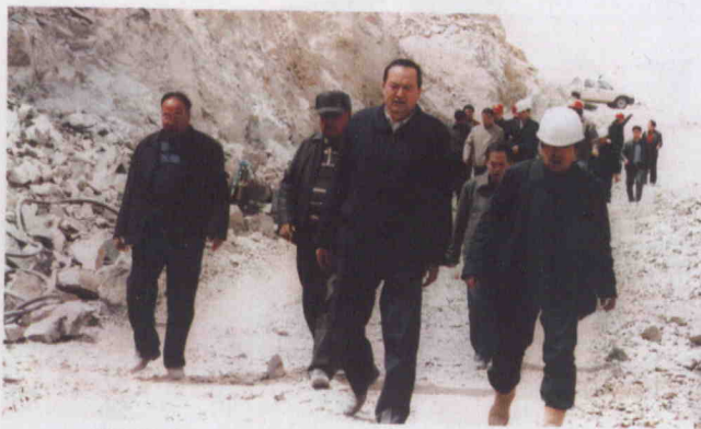
ئابدۇراخمان قۇربان كېرىيە ناھىيەسىدە قۇرۇلۇۋاتقان «بەخت ئاتا» سۇ ئامبىرى قۇرۇلۇشىغا يېتەكچىلىك قىلماقتا