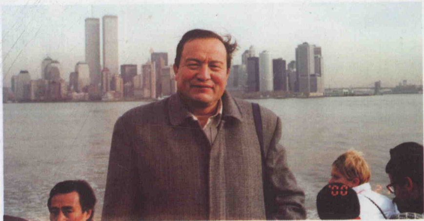
2000 - يىلى 12 - ئايدا ئابدۇراخمان قۇربان جۇڭگو ۋەكىللەر ئۆمىكى تەركىپىدە كانادانىڭ ۋانكۇۋېر، ئوتتاۋا، كۇبېك، تورونتو شەھەرلىرىدە، ئامېرىكىنىڭ نيۇ - يورك، فىلادېلفىيە، ۋاشىنگتون، كالىفورنىيە قاتارلىق جايلارىدا زىيارەتتە بولدى