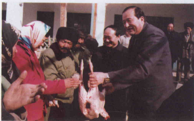
ئابدۇراخمان قۇربان قۇربان ھېيتتا ئاممىغا گۆش تارقىتىشقا