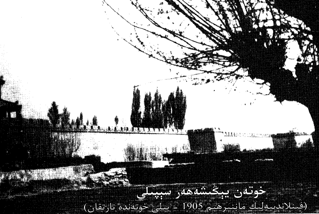
خوتەن يېڭىشەھەر سېپىلى (فىنلاندىيەلىك مائىپرەم 1905 - يىلى خوتەندە تارتقان)