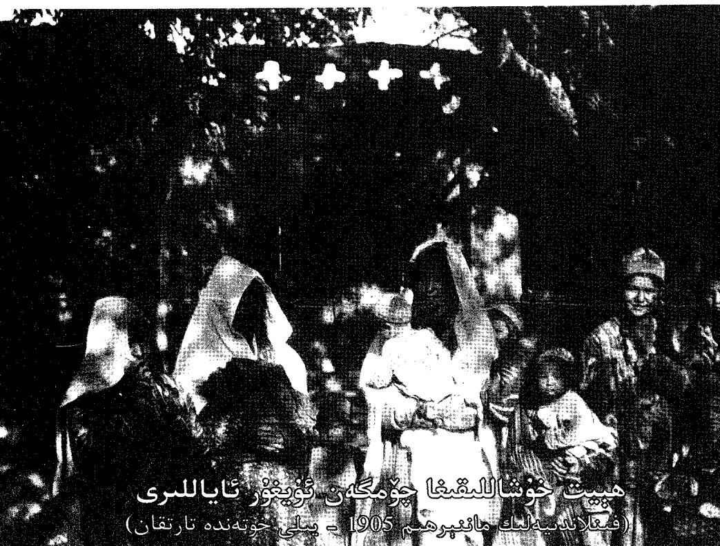
ھېيت خۇشاللىقىغا چۆمگەن ئۇيغۇر ئاياللىرى (فىنلاندىيەلىك مائىپرەم 1905 - يىلى خوتەندە تارتقان)