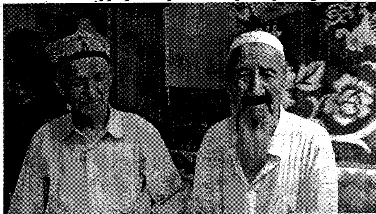
( ئاپتۇر ئابدۇۋاپىت توختى ئۆتمۈشتىكى يۇرۇڭقاش بازىرىنىڭ شاھىدى 90 ياشلىق ئىدىرىس

ھاكىمىيەت بىلەن كوممۇنا ئايرىلغاندا، يۇرۇڭقاش تەۋەسىدىكى خېلى بىرقىسىم كەنتلەر ئايرىپ چىقىلىپ، بۇيا يېزىسى قۇرۇلۇپ، يۇرۇڭقاشتا بازارلىق خەلق ھۆكۈمىتى تەسىس قىلىنغان. 2006-يىلى يۇرۇڭقاش بازىرى خوتەن شەھىرىگە قوشۇۋېتىلدى.