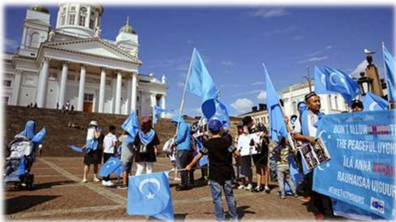
فىنلاندىيە شەرقى تۈركىستان جەمئىيىتى ئورۇنلاشتۇرغان 2018. يىلىدىكى 5. تومۇز نامايىشىدىن بىر كۆرۈنۈش