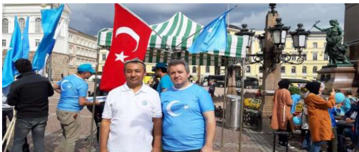
فىنلاندىيە شەرقى تۈركىستان جەمئىيىتى ئورۇنلاشتۇرغان 2019. يىلىدىكى 5. تومۇز نامايىشىدىن بىر كۆرۈنۈش